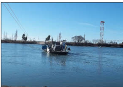
Figura 2. Transporte en balsa Guardia Mitre.

Los orígenes de esta localidad están vinculados con el establecimiento de fortificaciones, en una suerte de avanzada ante eventuales ataques aborígenes. Las acciones estuvieron dirigidas por el coronel Julián Murga, jefe del fuerte de Patagones, quién levantó una pequeña empalizada y un villorrio en el paraje llamado China Muerta en 1862, bautizada en su honor como Guardia General Mitre.