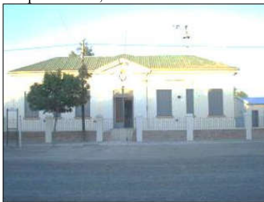
Figura 5. Hospital de Guardia Mitre.

Además se pueden visualizar procesos de aislamiento en la ausencia de espacios de sociabilidad y/o esparcimiento, el territorio no cuenta con organismos sin fines de lucro como cooperativas, asociaciones de productores, solamente una Sociedad Rural.