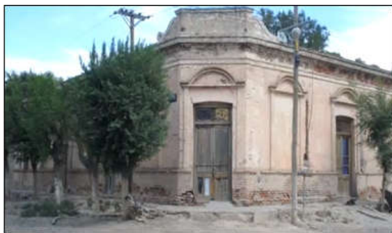
Figura 4. Fachada típica de las viviendas en Guardia Mitre.

En la localidad de Guardia Mitre hay un gran deterioro en su infraestructura urbana y habitacional, que se manifiesta en el tipo de viviendas, dado que las mismas son antiguas, precarias, generalmente de adobe, sin revestimiento, sin acceso a sistemas de cloacas, incluso algunas de ellas no cuentan con baño instalado en el interior (Gobierno de Río Negro, 2017). (Figura 4).